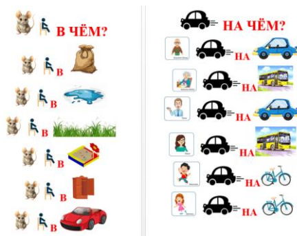
Рисунок 5. Отработка предложного падежа с глаголами «сидит, едет».

Самым сложным для детей является предложный падеж, он вводится последним. Предлагаются такие вопросы «Думать о ком? Думать о чем? Идет в чем? Стоит в чем? Кто в чем? Что в чем? Рисует в чем? Лежит в чем? Сидит в чем? Едет на чем? Сидит на чем? Лежит на чем? Спит на чем? Летит на чем? Барабанит на чем?». Используются предлоги «о, в, на». Например, при отработке предложного падежа с глаголами «сидит, едет» (рисунок 5) предлагаются фразы «Мышонок сидит в мешке. Мышонок сидит в траве» и «Дедушка едет на машине. Бабушка едет на автобусе».