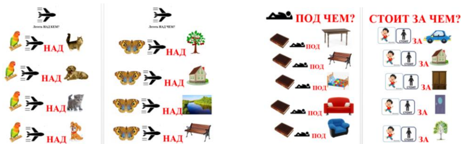
Рисунок 4. Отработка творительного падежа с глаголами «летит, лежит, стоит».

фразы с предлогами «с, над, под, за, между». Например, отвечая на вопросы «Летит над кем? Летит над чем?» (рисунок 4) дети отрабатывают такие фразы – «Попугай летит над кошкой. Бабочка летит над домом», «Книга лежит под столом», «Мальчик стоит за домом».