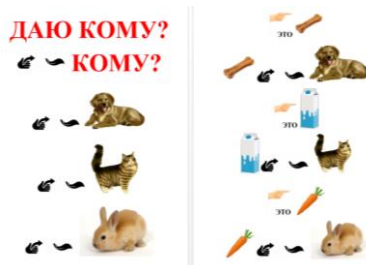
Рисунок 3. Отработка дательного падежа с глаголом «даю».

Дательный падеж вызывает определенные трудности у детей. Но, работая с тренажером, дети усваивают предлагаемый материал, отрабатывают фразы с глаголами «сказать, помогать, читать, подарить, даю, летит, едет, бежит, идёт». Используются фразы с предлогами и без них. При отработке дательного падежа с глаголом «даю» (рисунок 3) предлагаются фразы «Даю собаке. Даю кролику. Кость даю собаке. Морковь даю кролику».