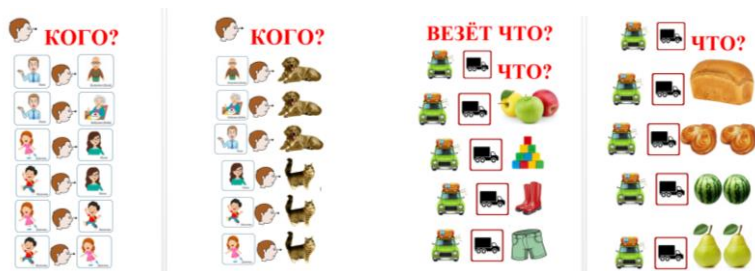
Рисунок 1. Отработка винительного падежа с глаголами «видит» и «везёт».

При отработке винительного падежа дети работают над фразами с глаголами «обнять, любит, искать, остановить, видит, везёт, несёт, читает, моет, покупает, ест, пьёт, кормит, стирает, гладит, надевает, вяжет, ловит, идёт». Используются не только знакомые глаголы, но и вводятся новые. Например, при работе над глаголами «видит» и «везёт» (рисунок 1) дети отрабатывают такие фразы – «Папа видит бабушку. Девочка видит маму» и «Машина везёт яблоки. Машина везёт хлеб».