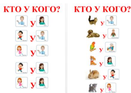
Рисунок 2. Отработка родительного падежа «Кто у кого?».

Работая над употреблением существительных в родительном падеже, дети отрабатывают фразы «Нет кого? Нет чего? Убегать от кого? Улетать от кого? Ждать кого? Кто у кого? Кто у чего? Что у чего? Добежал до чего? Вышел из чего? Стоит у чего? Сидит у чего? Что для кого?». Необходимо обратить внимание не только на правильное употребление существительного в родительном падеже, но и на понимание ребенком предлагаемых фраз. Например, при отработке родительного падежа «Кто у кого?» (рисунок 2) дети отрабатывают фразы «Папа у мамы. Дочка у папы. Собака у дедушки. Попугай у бабушки».