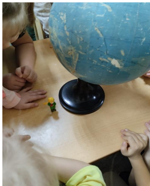
«Маленький принц посетил нашу группу»

Продолжая тему взаимосвязи детей и взрослых в ДОУ, в подготовительной группе была проведена литературная гостиная, посвященная примерам духовно-нравственного воспитания начала XX века. Именно здесь, опираясь на мнение авторитетных педагогов и мыслителей, познакомили