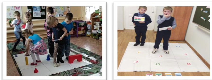
Рис. 5 Авторская напольная игра «Телевизор»

называет какой это звук гласный или согласный. Всё зависит от цели, которую мы преследуем на занятии. Вариантов у игры множество.