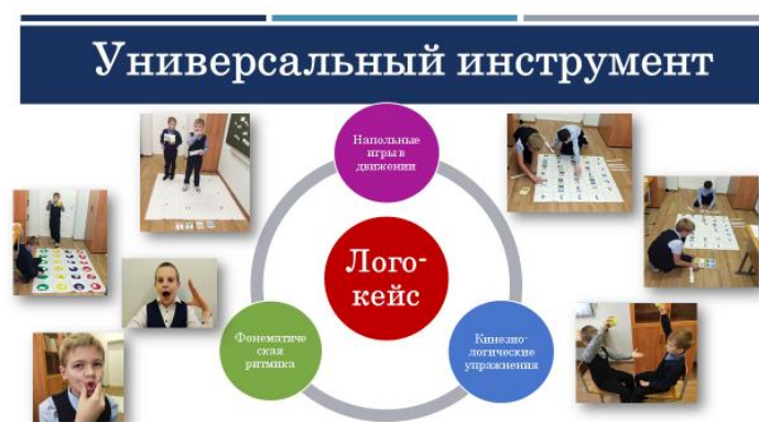
Рис. 1 Лого-кейс – универсальный инструмент коррекции речи.

Для этого существует множество технологий, методов, приёмов, но я как начинающий специалист в этой области собрала свой, на мой взгляд, универсальный инструмент коррекции речи под названием «Лого-кейс»