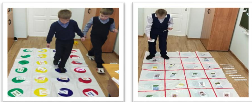
Рис. 4 Авторская напольная игра «Матрица»

индивидуальных, так и на групповых занятиях с любыми детьми, подстраивая под определённый уровень развития ребёнка и замысел педагога.